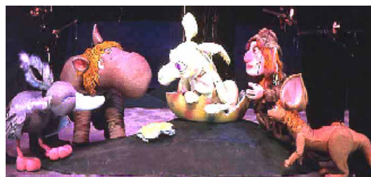
左から ガーバ・ダバダバ・チキチキ・キウイ・ストック