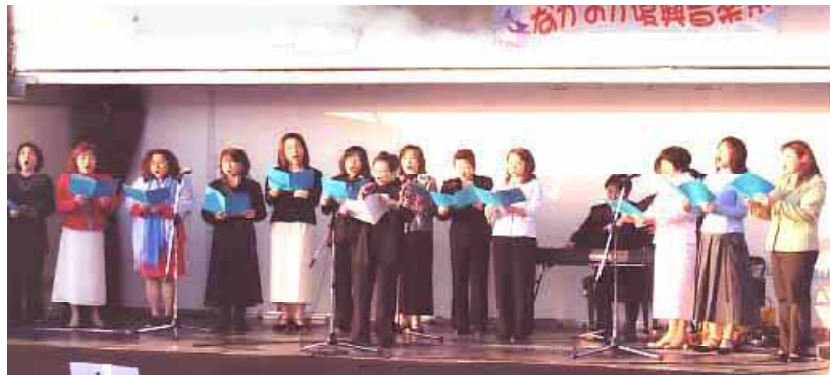
復興音楽祭記念曲発表の様子

4月23日は普通の土曜日のはずでしたが、中越大震災から、ちょうど半年目の日にあたるといって、何かをやらなければという気持ちでスタートした「ながおか復興音楽祭」が盛大に行なわれました。10月23日の地震のために、市民音楽祭もコーラスフェスティバルも中止となり、秋に予定されていた定期演奏会も延期せざるをえなくなり、音楽を愛する人々の気持ちの中に充満していたものが一気に爆発したのです。実行委員会を立ち上げるのが遅れたことやPR不足で、おいでになったお客様の人数はそれほど多かったとは言えませんが、コンサートホールの夜の部の吹奏楽はじっくりと聞かせていただきました。あの時のステージのエネルギーは今でもはっきりおぼえています。多くの苦勞がありましたがやって良かったという気持ちでいっぱいです。