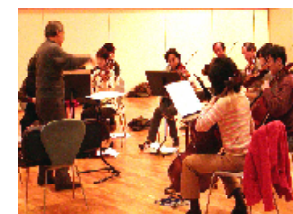
昨年度の講座風景

SAWA QUARTETメンバーによる弦楽アンサンブルの講習会を開催します。また、最後に、リリックホールでの演奏会や市内での出張コンサートを行います。 演奏のレベルアップをめざす方、弦楽の合奏法を学びたい方、どうぞご参加ください。