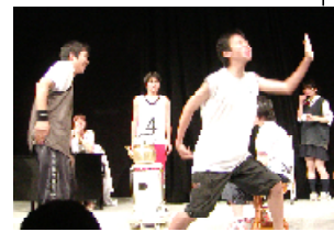
昨年度の稽古風景

対象：高校生 定員：20名 参加料：無料 会場：リリック・スタジオ等 申込締切：6/27(日)(応募者多数の場合、抽選) 助成：文化庁、(財)地域創造