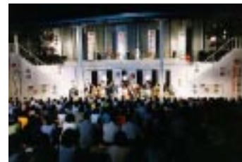
7/21・22・23 リリック野外劇「じゃじゃ馬ならし」